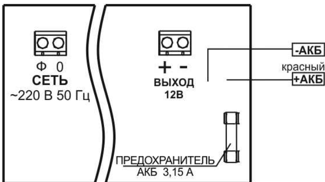
Рисунок 2 — схема подключения.